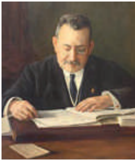
Enric Prat de la Riba, primer president de la Mancomunitat de Catalunya, 1914-1917. Enric Prat de la Riba, premier président de la Mancommunauté de Catalogne, 1914-1917.

tad popular catalana exige imperiosamente, más o menos acentuadas o atenuadas, formas de Estado».