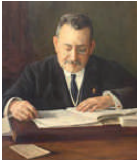
Enric Prat de la Riba, primer president de la Mancomunitat de Catalunya, 1914-1917. Enric Prat de la Riba, first president of the Commonwealth of Catalonia, 1914-1917.

dar demostrada la capacitat dels catalans per a regir-nos. De fet, tot i la seva dissolució prematura amb la dictadura de Primo de Rivera, la Mancomunitat va sembrar la llavor per la reinstauració del que posteriorment seria la Generalitat Republicana i, passada la Guerra civil i la Dictadura franquista, la Generalitat actual, institució continuadora d'una sòlida voluntat que, tot i arrelar en el passat, s'ha desenvolupat sempre cara el futur.