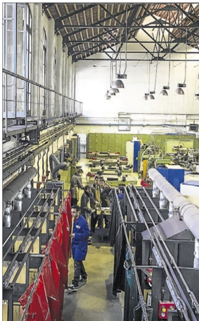
▶▶ Alumnes en un taller de l'Escola del Treball, ahir.

El 1945, Europa va apostar pel model industrial però Espanya va seguir ensenyant oficis