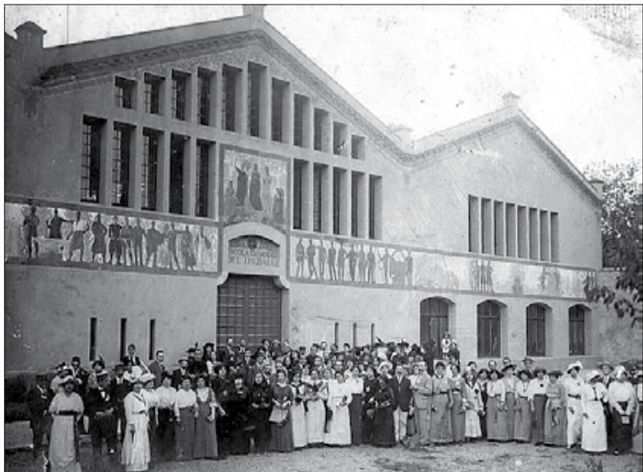
▶▶ Imatges històriques del centre. A dalt, una visita de Franco el 1945.