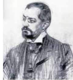
Josep Puig i Cadafalch 1932

Després començaren, a poc a poc, les obres per al nostre local actual que s'iniciava en 1914, i que semblava difícil d'omplir. Un regidor benemerit s'espantà i aterroritzà perquè demanàvem cinc-cents mil pessetes per llibres i es discutí seriosament en la premsa, per esperits selectes, si havíem de fer una biblioteca popular de manuals i llibres de divulgació.