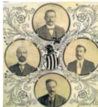
Enric Prat de la Riba 1914

cessita per a realitzar el nostre ideal? [...] Val massa per al nostre poble el que esperem de la Mancomunitat. Volem donar a la nostra llengua la plenitud d'imperi sobre tota la vida nostra, i, ja que no ha pogut aconseguir l'expansió territorial gloriosa d'altres llengües germanes, donar-li en intensitat el que en extensió sempre més ha de mancar-li. Volem que el nostre pensament no sigui, com ho és fins ara el de totes les regions ibèriques, exclòs de la col·laboració universal; que la investigació científica nostra s'avanci a treballar en les línies avançades on es lliuren les batalles de la ciència, [...]. Em resta pronunciar les frases sagramentals, les frases rituals que en el dret públic universal assenyalen el moment precís, solemne, en el qual neix amb eficàcia jurídica un poder, una funció, una institució, que marquen quan un poder que abans no existia comença a existir; quan una institució que abans no era comença a ésser, a viure en plenitud de personalitat jurídica. [...]