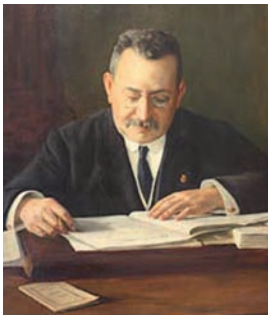
Enric Prat de la Riba, primer president de la Mancomunitat de Catalunya, 1914-1917. Enric Prat de la Riba, first president of the Commonwealth of Catalonia, 1914-1917.

dar demostrada la capacitat dels catalans per a regir-nos. De fet, tot i la seva dissolució prematura amb la dictadura de Primo de Rivera, la Mancomunitat va sembrar la llavor per la reinstauració del que posteriorment seria la Generalitat Republicana i, passada la Guerra civil i la Dictadura franquista, la Generalitat actual, institució continuadora d'una sòlida voluntat que, tot i arrelar en el passat, s'ha desenvolupat sempre cara el futur.